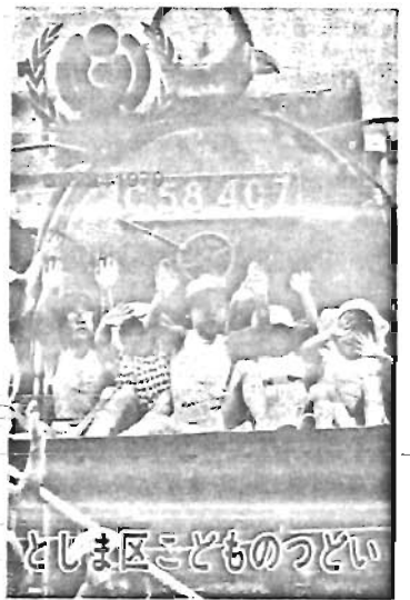
としま区こどものつどい

10月4日は区内生鮮食品安売りデーです。「のほり」の立っている鳥肉・魚・肉・青果の協力店が一斉に安売りをします。ご利用ください。