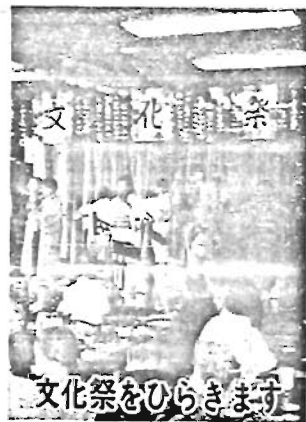
文化祭をひらきます

映画会のお知らせ とき：10月16日(火) 午後1時30分から 申込み：当館窓口か、電話 04-5896へ。