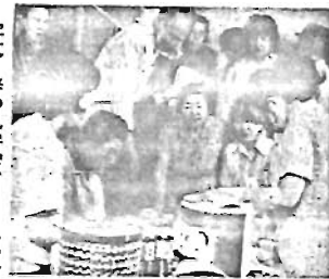
写真II春の見学会(さくらの家)

区民の皆さんに、区の施設を見学していただき、区政に対する理解を深めていただくため、施設についてのご意見、ご要望等をお聴きするため、次のとおり施設見学会を行います。 今回は団体による見学会です。 ◇日時 第1回：10月18日(木) 第2回：10月23日(火) 第3回：10月24日(水) ◇見学コース 区役所→東鴨体育館→南大塚こどもの家→南大塚児童館→南大塚保育園→中央図書館→さくらの家→千早社会教育会館→西池袋図書館→区役所 ◇募集団体 3団体(1団体20名以内) 申込み