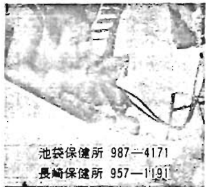
池袋保健所 987-4171 長崎保健所 957-1191