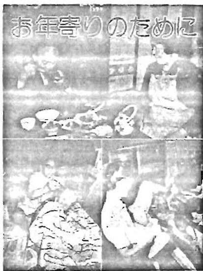
お年寄りのために

老人福祉手当の支給 区内に居住している65歳以上の 方で、6か月以上寝たきりの状態 にあり、その状態が継続すると認 められる方に支給されています。