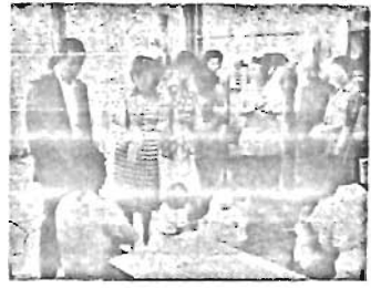
区立竹岡健康学園の入園児童募集

健康学園は偏食、ぜんそく、肥満、身体が弱いなどの児童を対象に、扇形半島の恵まれた自然環境の中で、健康増進と体力向上をめざすところ。 寮では、保護者が両親のかわりになって、家庭的な雰囲気の中で、児童の身の回りの世話をし、協調性や自主性を養っていきます。 各学年とも一級定員20名で区内の小学校と比較すると、個人指導が行き届きます。 現在、4月10日から始まる昭和55年度前期入園の児童を募集しています。お子さんのために、ぜひご利用ください。 ◇入園できる児童: 区立小学校3年生以上(現在2・5年生)です。 ◇入園期間: 前期が4月10日から8月9日まで。後期は10月11日から3月6日(予定)まで。 ◇入園手続き: 現在通学している学校にお申込みください。 ◇費用: 1か月2万2千円程度です。なお、家庭の状況により減額制度もあります。 ◇お問い合わせ: 学務課保健係 34333まで。