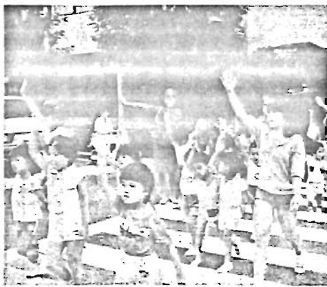
「お先へどうぞ」「ありがとう」 —交通安全は ゆずり合いから—

この運動は、すべての区民が「交通安全はゆずり合いから」を言葉に、自ら進んで交通ルールとマナーを守り、安全でさわやかな道路交通の場を確保して、交通事故と交通公害の防止を図ることを目的として実施します。