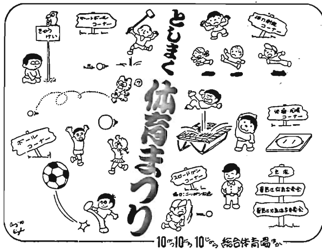
10月10日、10日、総合体育場