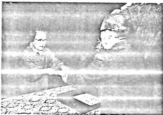
12月5日に行われた委嘱状伝達式

② カーブの手前ではスピードをおとしましょう。 ③ 交差点では必ず安全を確認しましょう。 ④ 一時停止で横断歩行者の安全を守りましょう。 ⑤ 飲酒運転は絶対にしないようにしましょう。 にしましょう。 今年も残りわずかです。年末は人の動き、車の動きがあつただしくなり、それに伴って交通事故が多発が予想されます。みんながルールを守って、交通事故を起こさないようにしましょう。 民生委員は、11月30日をもって3年の任期が満了するため、全国一斉に改選の手続きが進められてきました。ご存じのように、民生委員は地域の福祉向上に力を尽くす社会奉仕者ですので、社会福祉に熱意のある人格優良に高い人であることが求められています。 従って、豊島区では民生委員として適格な候補者を選出するため7月以来各出張所単位に設けられている民生委員・児童委員候補者推せん予選会及び区の民生委員推せん会で選挙を重ね、26名の候補者を都知事に推せんしたところ、このたび12月1日付をもって全員が厚生大臣の委嘱を受けることになりました。 『民生委員の役割』 ☆アンテナの役割―担当地域内の実情をよく把握すること。 ☆世話役の役割―いつでも親身に なつて相談を受け助言をすること ☆告知的役割―福祉サービスをよく知り、必要な方への周知に努めること。 ☆パイプ役の役割―住民と行政や関係機関との間の連絡調整役。 ☆代弁者の役割―福祉施策の実施運用について地域住民の立場から建設的な意見を提出すること。 民生委員は、要約して以上5つの役割をもっていますが、同時に法律で児童委員も兼ねることになっており、児童の健全育成の立場からの援護、指導及び母子福祉に関する諸制度の周知指導等を務める役割も合せてもっています。 新しい民生委員の名簿は2ページに掲載してありますが、それぞれ担当区域がありますので、お問合わせはお近くの民生委員か、厚生部管理課庶務係(2611)2へどうぞ。