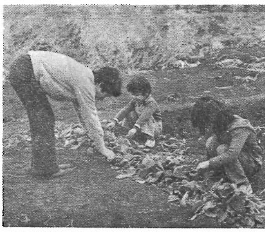
手づくりの野菜を食卓に 区民農園一覧表

◇利用できる面積：1区画約15㎡ ◇利用できる期間：昭和56年4月5日～昭和57年2月28日 ◇使用料：無料 ◇応募資格：豊島区に居住し、住民登録をしていて、農芸に熱意のある世帯 ◇農具：各農園の物置に用意してあります。 ◇農芸指導：指導員が、農具の使い方や肥料のやり方等を指導しますので、初心者の方でも安心して