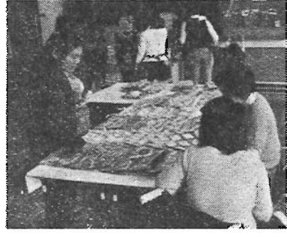
日頃の成果をこの日に

心身障害者の通所施設である豊島区立「さくらの家」では、この一年間の歩みを見ていただく場として「さくら祭」を催します。当日は作業実演、作品の展示、喫茶コーナー、バザー等を予定しています。 国際障害者年を迎え、なるべく多くの方々に「さくらの家」の日常の生活を覗いていただくために、お誘いあわせのうえ、お出かけください。 日時：3月15日(日) 午前10時~午後2時 場所：豊島区目白5-18-8