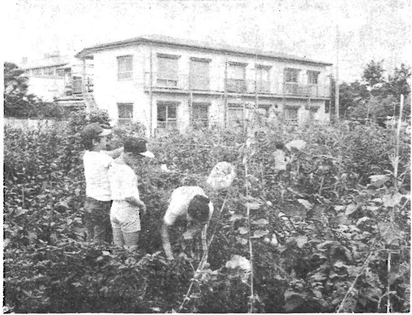
家族揃って土に親しみましょう