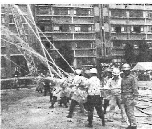
昨年9月に行われた防災訓練

また、毎年、関係機関のご協力により実施してまいりました総合防災訓練については、地域防災センターの活動を中心とした訓練に