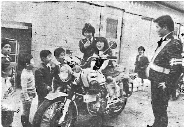
楽しく学んで正しい交通ルールを

春の交通安全運動が、4月6日から15日までの10日間、全国いっせいに開催されます。この運動は、すべての区民が「やさしく走ろう TOKYO」を合言葉に、進んで正しい交通ルールとマナーを身につけて、安全でさわやかな道路交通の場を作り出し、交通事故と交通公害の防止を図ることを目的としています。