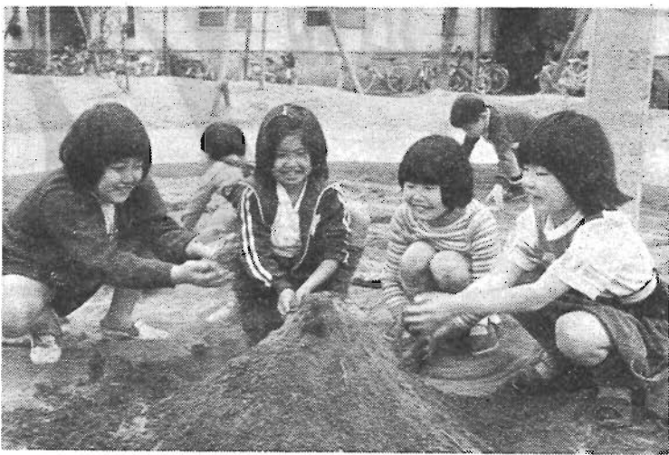
元気に遊ぶ子供たち

20歳未満で、心身に障害があり、以上の各手当は、それぞれ受給資格に該当している場合、併せて支給されます。