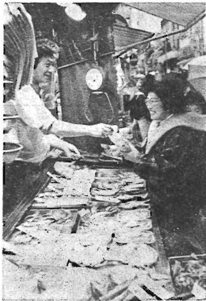
買物客でにぎわう商店街

区では、昨年に引き続き今年も『憲法記念のつとめ』を開きます。今年も、完全参加と平等をテーマとする国際障害者年です。幸せに生きる権利、ともに生きる社会について、憲法とのかかわりを考えてみましょう。 お問い合わせのうえ、ぜひお出かけください。手話通訳の用意があります。 ◇日時：5月2日(土)午後1時30分～5時 ◇会場：区民センター文化ホール