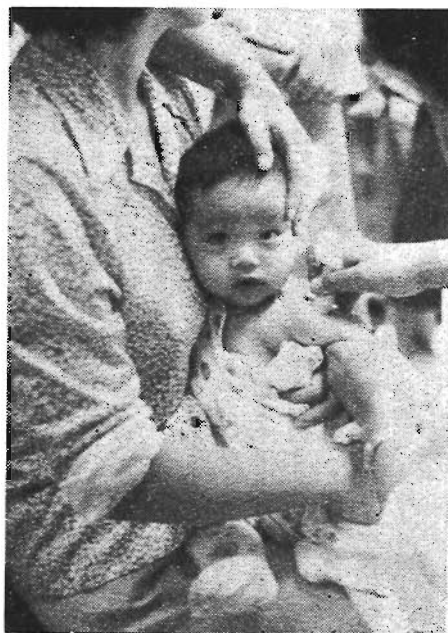
夏の赤ちゃんの健康には十分注意を

ください。また、この季節には、いろいろなウイルスや細菌が繁殖します。いわゆる「夏かぜ」を起