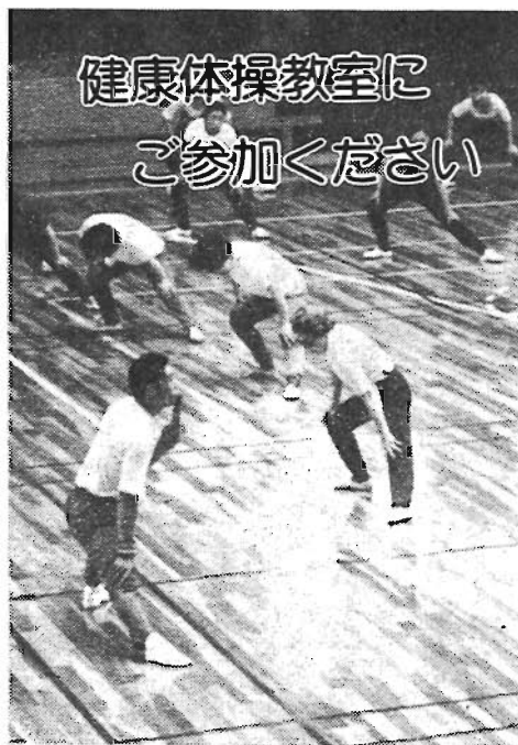
健康体操教室にご参加ください

「食べること」「身体と心を休めること」となっていて「身体を動かすこと」は健康づくりの一つの柱です。