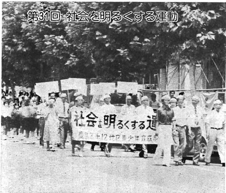
第31回 社会を明るくする運動