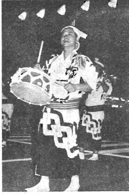
今年の阿波踊りは9月5日

9月初旬、夏のなごりを残しながらもふと秋風を感じ、恒例の大塚阿波踊り大会が催されます。10万人以上の大観衆に埋まり、かね、太鼓、笛と阿波踊り独特のおはやしに、老若男女千人が一堂に踊りまくる姿は、まさに圧巻、一大絵巻を見るようにあでやかなすばらしいイベントです。