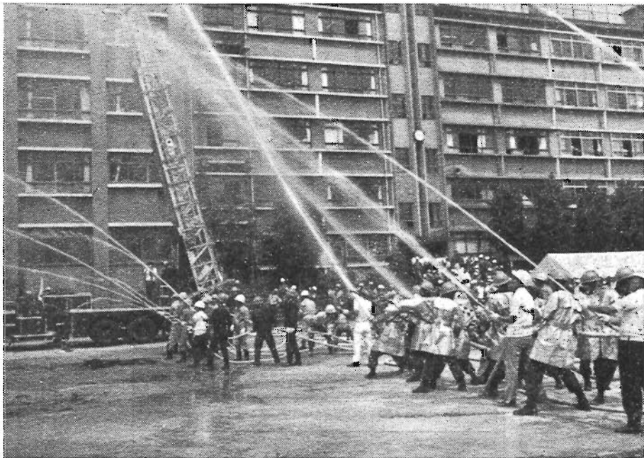
昨年行われた総合防災訓練（高田中学校にて）

このため、区では従来から最も重点的に行ってきた「警戒宣言」の発令時の対応と、直下型地震等の災害発生時を想定して、防災機関