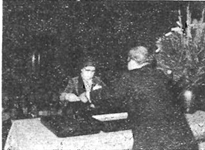
豊島区功労者表彰される

区の振興発展や区民福祉の向上に貢献されました56名の豊島区功労者が、10月1日に区民センターで表彰されました。