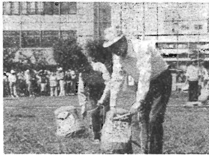
老人スポーツ祭開催

区の振興発展や区民福祉の向上に貢献されました56名の豊島区功労者が、10月1日に区民センターで表彰されました。