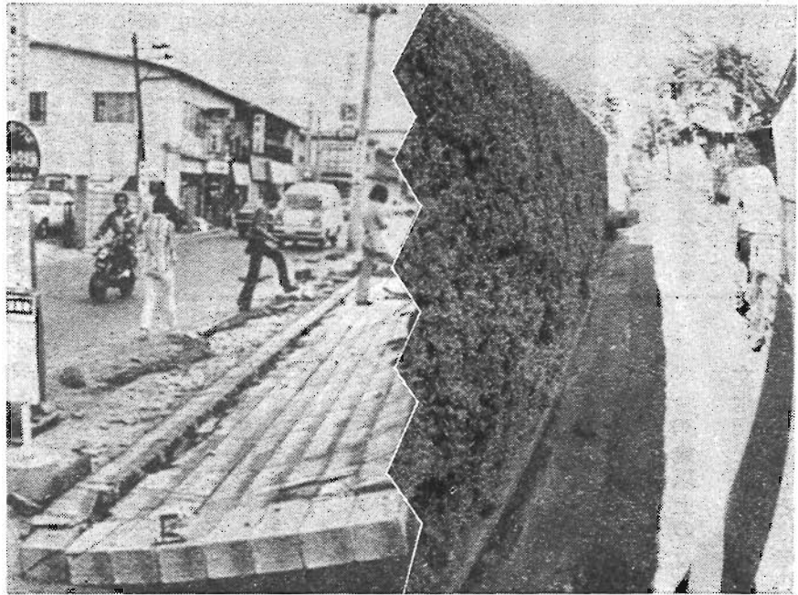
宮城県沖地震で倒壊したブロック塀（左）と整備された生垣（右）

区では、緑豊かな生活環境を確保するため、4月から生垣の造成費用の助成を行っています。