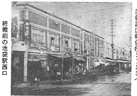
終戦前の池袋駅西口

豊島区では、本年10月1日に迎える区制施行50周年を記念して、写真集『目でみる豊島区50年のあゆみ』(仮題)を発行する予定です。 この写真集は、豊島区の昭和史を主体に、明治・大正期のめづらしい写真も掲載しながら、世相、行政、区民生活、街の移り変わりなどをみてもらおうというものです。 また、あわせて『区制施行50周年 写真・資料展』を開く準備も進めています。 そこで、この写真集及び写真・資料展に掲載する予定です。 写真や資料を集めています。 写真は、衣食住、風景、行事、風俗など、区民の日常生活を撮ったものなら何でも結構です。カラー、白黒、フィルム、印刷紙は問いません。アルバムに貼ってある懐かしい写真をぜひお貸しください。