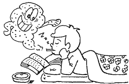
酔った時の寝タバコはあぶない