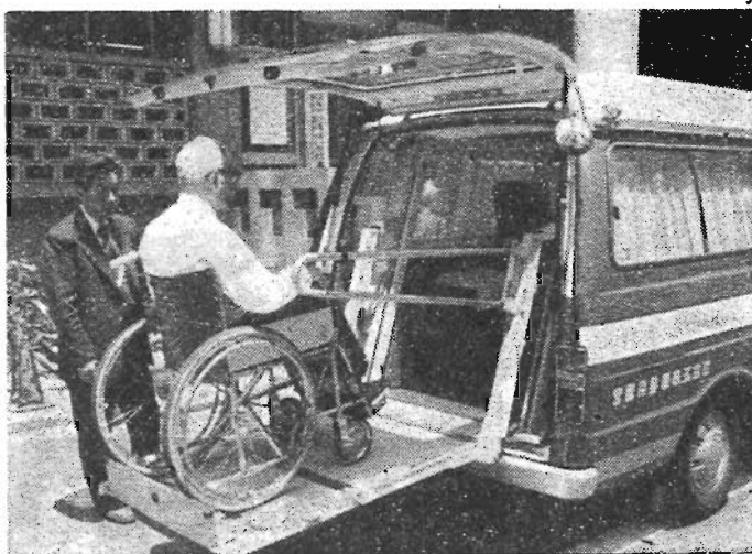
リフトにより車いすのまま乗降できます

車いすや移動段台車に乗ったまま乗り降りできるリフト付き福祉ハイクーヤを運行しています。通院、会合、訪問などの日常生活にご利用ください。