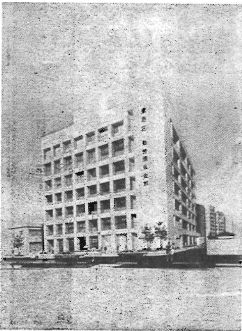
勤労福祉会館の完成予想図