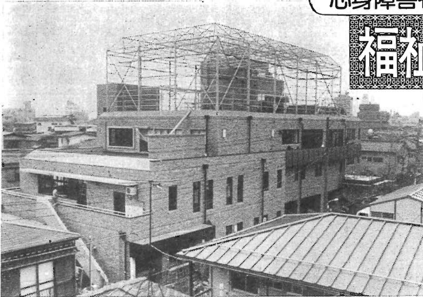
この施設は、年金の積立金から還元融資を受けて建設されたものです