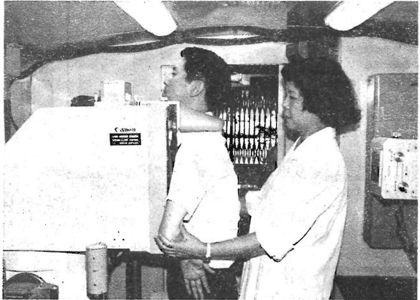
成人病検診を受けましょう

これらの成人病から自分を守るためには、常に自分の健康状態を把握しておくことがたいせつです。成人病は突然襲ってくるものではなく、症状のないまま徐々に進行し、症状が現われた時は手遅れといったことが多いものです。そこで、定期的に循環器検診や