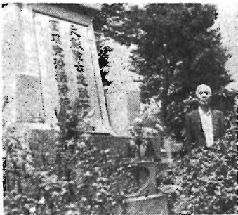
▲漱石の墓碑の前で

前年の所得が、左表の限度額をこえないこと。 ◇支払方法：4月、8月、11月にそれぞれ前月分までをまとめて本人の口座に振り込みます。 ◇詳細：福祉係 2626