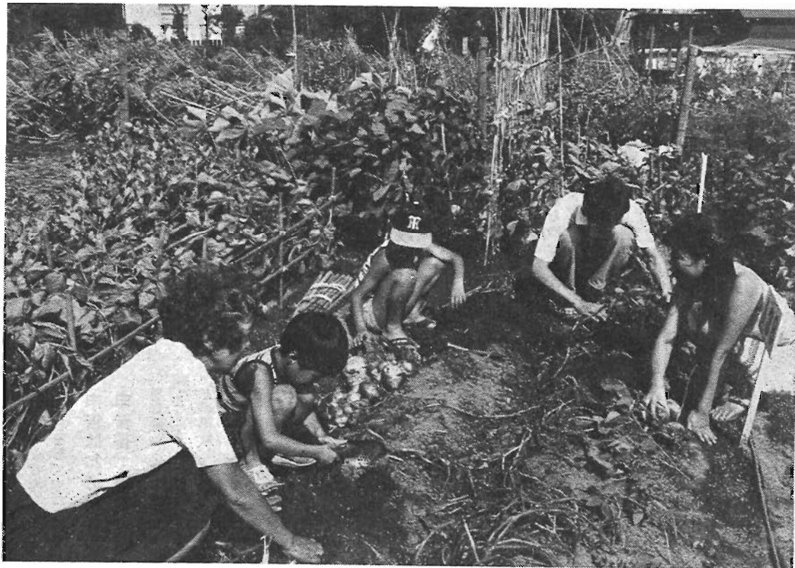
家族みんなで野菜づくり……「おいものあとは何を植えようかな」