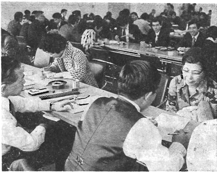
正しい申告を…… (昨年の申告風景)

なお、所得税の確定申告をする方は、住民税や個人事業税の申告をする必要はありませんが、確定