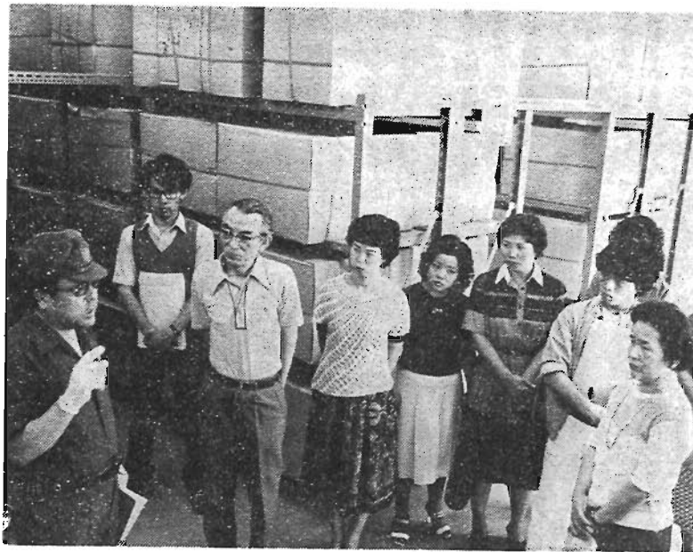
施設見学会(写真上) と連絡会議(写真下)

日常生活に密接な関わりあいのある区政は、区民の皆さんの区政に対するご意見ご要望を的確にとらえて運営されなければなりません。このため区では、「区政モニター」、「陳情・請願」、「広聴はがき」、「世論調査」などの広聴活動を行っています。 このたび、57年度の区政モニターが任期満了となりますので、あらたに58年度の区政モニターを募集します。多くの方のご応募をお待ちしています。