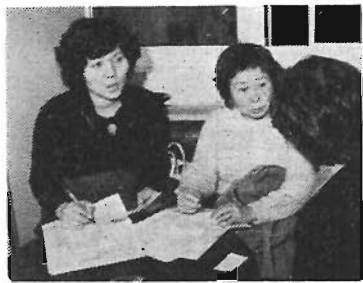
熱心に説明を聞くレポーター

豊島区社会福祉協議会にはボランティアコーナーがあり、そこでボランティアとボランティア派遣希望者の相互受付や連絡などを行っています。