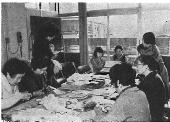
真心込めて1針1針 (さわる絵本作り)

一人でも多くの方に参加してもらい、皆んなで励まし合い、助け合っていけたら、また、そこで人と人の触れ合いや深い絆が生まれたい、どんなにすばらしいかと思えます。