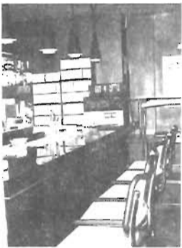
カラオケもどうぞ！