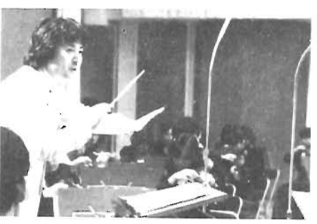
豊島区管弦楽団の練習風景