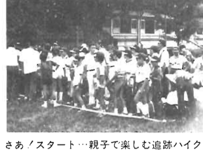
さあ、スタート...親子で楽しむ追跡ハイク