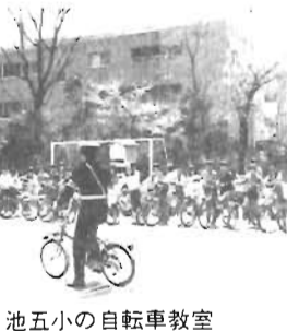
池五小の自転車教室

Aのお母さん方も出席し、子ども達自身が交通安全に取り組み手助けをしています。通学路の要所要所に立って、通学の安全を守るのもお母さん達の重要な役目です。