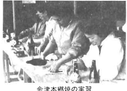
会津本郷焼の実習

四本の柱に囲まれた空間に生みだされる能の世界をみようとするときに、多くの視点があると思います。