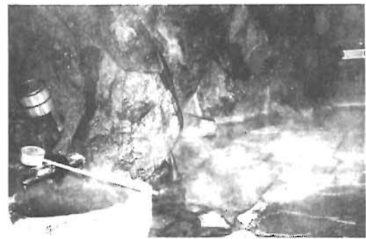
史蹟ともなっている露天風呂