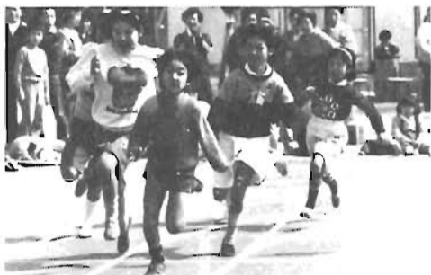
さあ、スタート...親子で楽しむ追跡ハイク

健康で明るい対話のある家庭づくり 青少年育成を考えたとき、家庭は、人格形成の場として、教育の場として、家庭の愛情に支えられる心の安定の場として重要な役割を担っている。 われわれは、このような家庭のもつ重要な役割について再認識し、健康で明るい対話のある家庭づくりの呼びかけを一層強めていく必要がある。