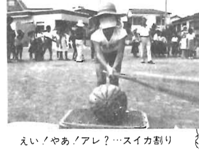
えい、やあ、アレ?...スイカ割り