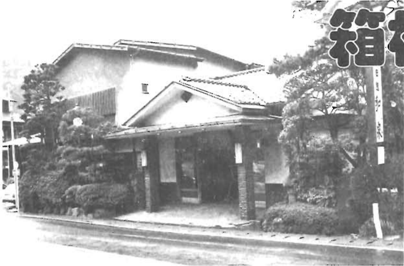
純日本風旅館「和泉」