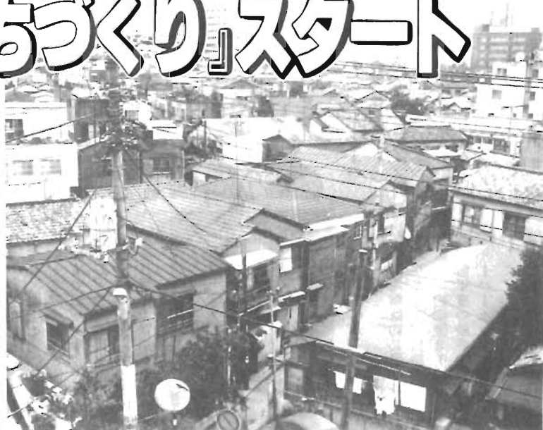
まちづくり説明会の日程と対象区域