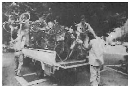
やがて廃棄処分に —大塚駅前での撤去作業—

置自転車特集号」による利用自粛や放置防止の呼びかけなど努力が続けています。しかし、その成果が十分表れていないといえず、結局は撤去・廃棄処分というのが現状のようです。