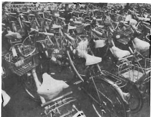
やめよう！自転車の放置は —大塚駅前—

また、郵便車やゴミ収集車も運行が妨げられ、迅速な作業ができないと、しばしば苦情が寄せられています。このように、放置自転車は、いろいろな形で、私たちの生活環境を悪化させているのです。