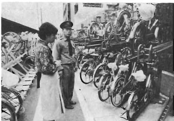
金町駅北口に新設された自転車置場

一方、置き場を確保することから始めました。従来、無料駐留場を整備するとともに、駅近くには有料駐留場を新設しました。そして、この駐留場には、区から許可をもらった自転車だけが料金を払って利用できるようなしたわけです。駅に近い人は利用許可はもらえません。