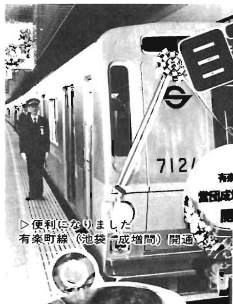
▷便利になりました 有楽町線(池袋-成増間) 開通