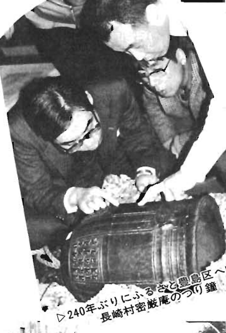
▷240年ぶりにふるさと豊島区へ帰った 長崎村密蔵庵のつり鐘