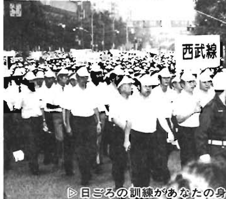
▷日ごろの訓練があなたの身を守ります 総合防災訓練