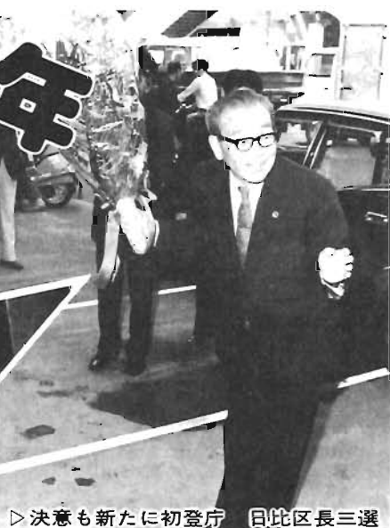
▷決意も新たに初登庁 日比区長三選