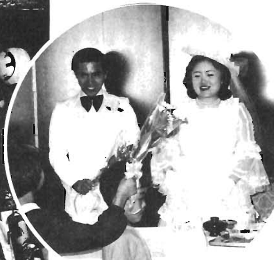
▷あつあつカップルおしあわせに! ウェディング豊島1万組達成