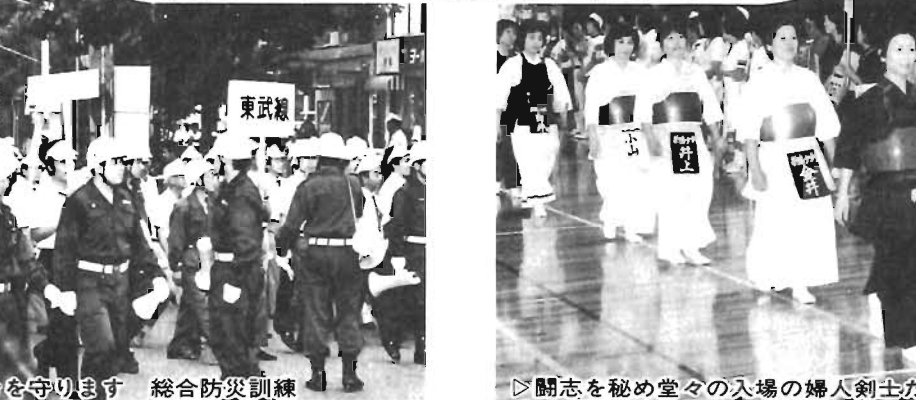
▷闘志を秘め堂々の入場の婦人剣士たち 第4回家庭婦人総合スポーツ大会