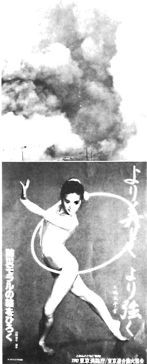
(58年豊島区内の火災状況)