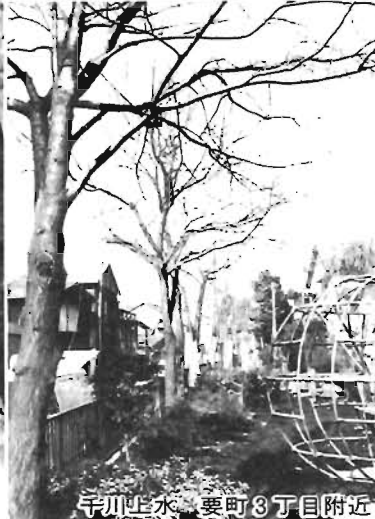
千川生水 要町3丁目附近