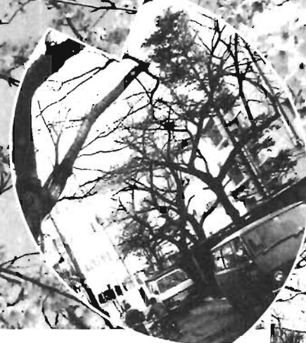
西福寺前 駒込6丁目