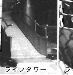
ライフトワーでの避難訓練

14時30分——訓練指揮係からゆっくりとした、わかりやすい言葉で訓練の予告が、2回繰り返して放送された。 14時35分——非常ベルが鳴る。同時に「3階調理室から出火した。各員は指導員の指示に従って、すぐに地上に避難しなさい」とのアナウンス。一寸、センター内に緊張の色が走ったが、別にあわてる様子もなく、3階にいた利用者は、2班に分かれ、2つの階段から降り、1分余で