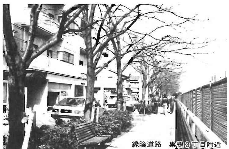
緑陰道路 巣鴨3丁目附近

都会ではめずらしく雪の多いこの冬でした。でも春は確実に近づいています。そして、春は桜の開花とともにやってくる。その小さな木である「そめいよしの」も、その小さなつぼみをつけ始めました。その形さえ確認できないほどの小さなつぼみですが……。