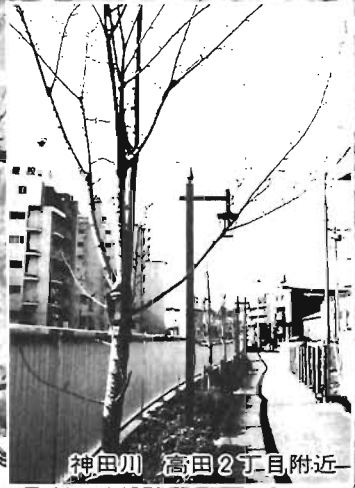
神田川 高田2丁目附近