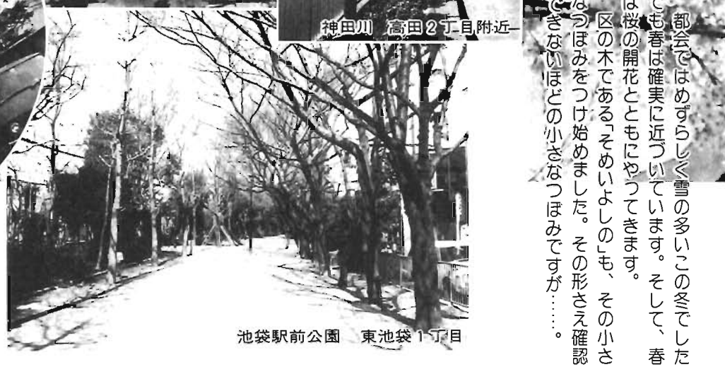
池袋駅前公園 東池袋1丁目

都会ではめずらしく雪の多いこの冬でした。でも春は確実に近づいています。そして、春は桜の開花とともにやってくる。その小さな木である「そめいよしの」も、その小さなつぼみをつけ始めました。その形さえ確認できないほどの小さなつぼみですが……。