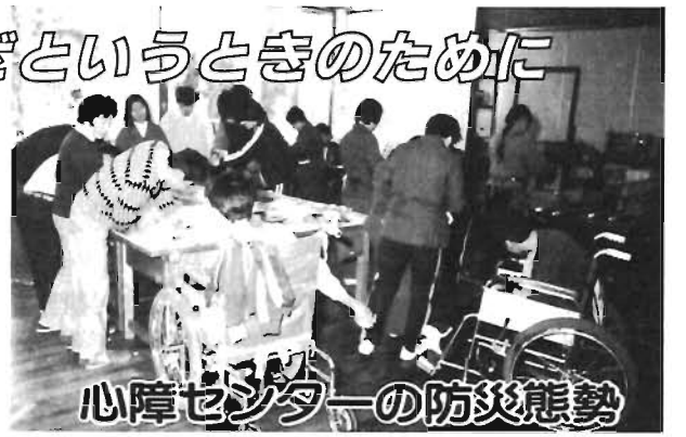
心障センターの防災態勢

昨年6月8日、区政モニターの施設見学会の際、初めて心身障害者福祉センター(自由5の18の8)を訪れました。大変立派な施設で、非常事態発生時の対策も十分整備されていて感心しました。 ただ、心身障害者の施設なので、実際に災害が発生したとき、これらの対策が功を奏することができるか、利用者全員が無事に避難できるのか、一抹の不安を感じたものです。 その後、実際に避難訓練を見学する機会を得ましたので、そのときの様子を伝えるとともに、当センターの防災対策について紹介いたします。