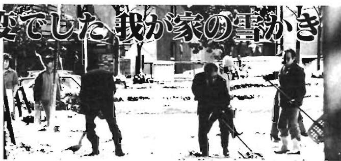
我が家の雪かきで大変でした