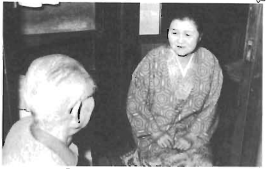
「おじいちゃん、元気ね」

区では、区民の皆さんの近所に住んでいる、ひとり暮らしのお年寄りのために、皆さんの協力を得て、次の事業を行っています。さらに、より多くの方のご協力をお願いします。あなたの善意を生かしてみませんか。