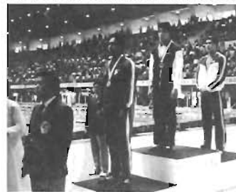
4月のアジア選手権で2種目優勝

弱冠14歳。区立大塚中の3年生。競泳男子では戦後初の中学生選手であり、ロス五輪代表選手の男子最年少選手でもある。とまどっています。まさかあの子がロスへ？夢にも思っていないでしたから