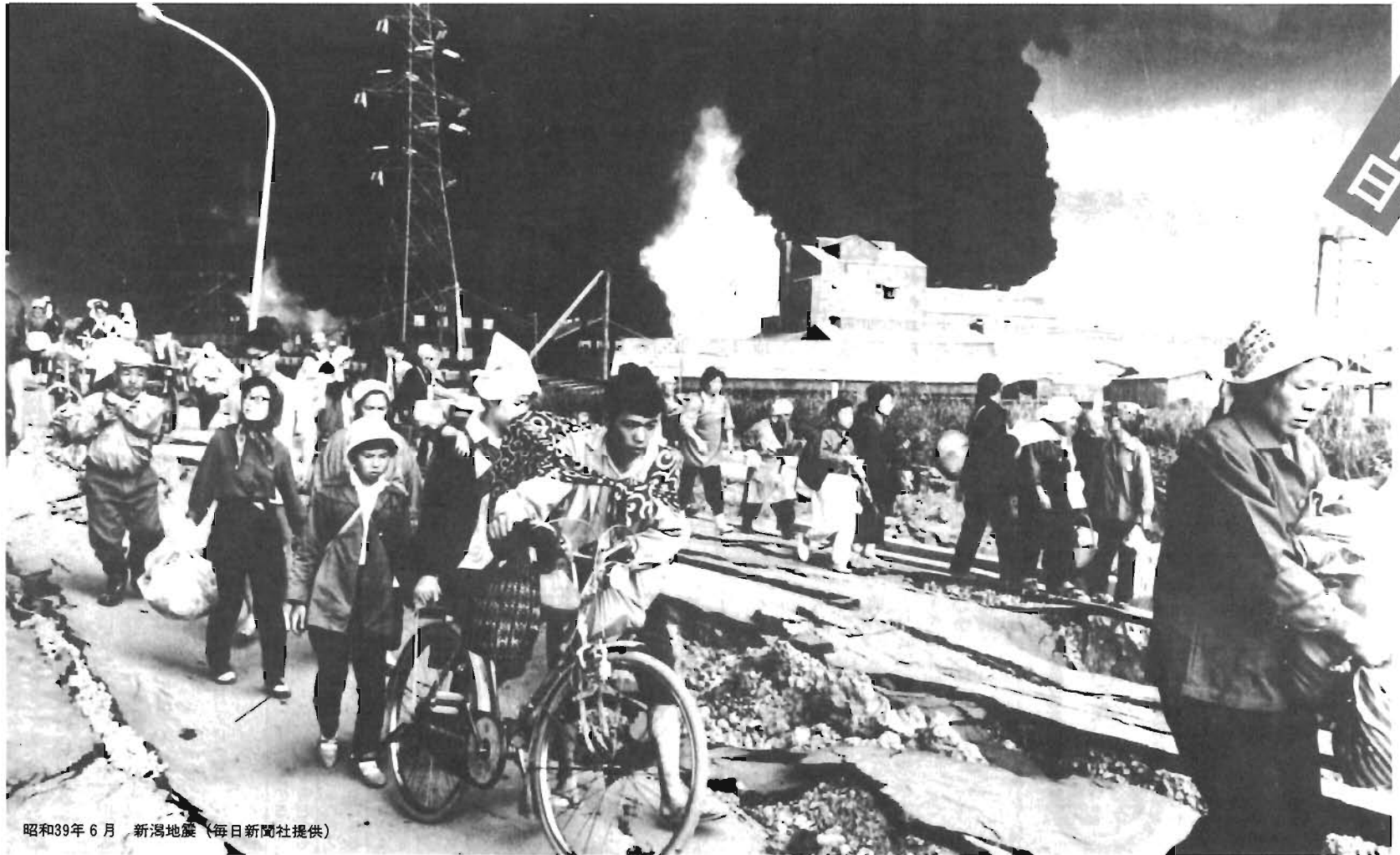
昭和39年6月 新潟地震

夏の交通事故をなくそう 健康管理を完全に 子供にいつもより注意の目を 飲んだら乗るな 乗るなら飲むな