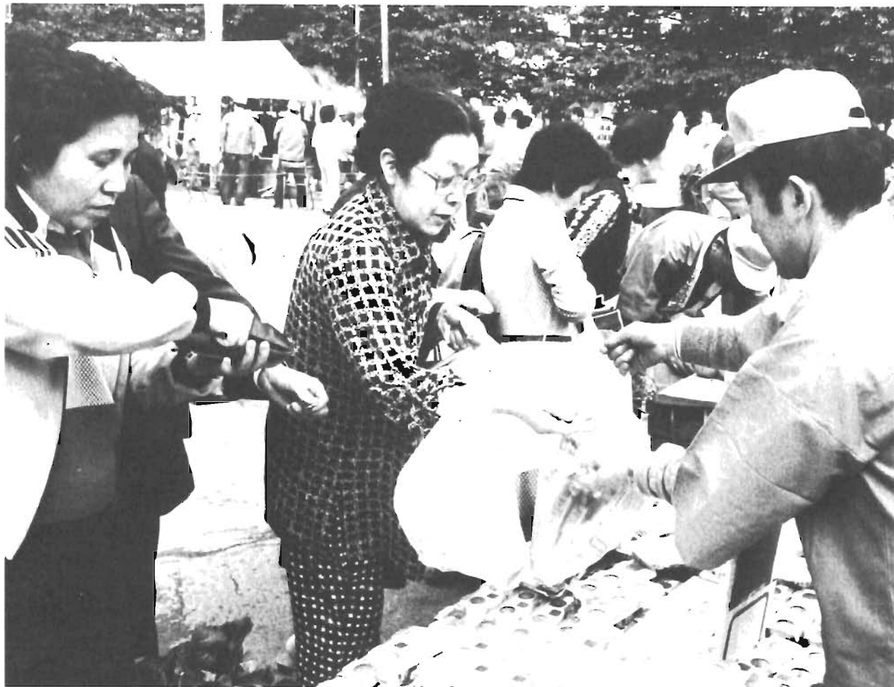
区民でにぎわう今年の春の生鮮食品即売市