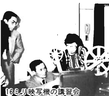
16ミリ映写機の講習会

●土曜映画会 11月24日 午後1時30分から中央図書館▽映画：「典子は、今」(カラー)1時間57分▽入場：無料▽定員：50名(先着順)▽詳細：中央図書館 事業係 983-7861