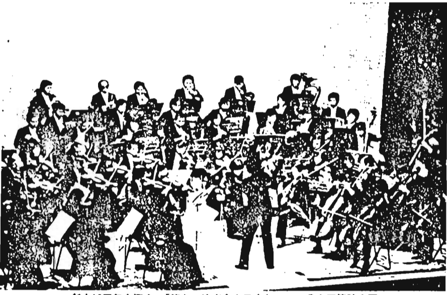
創立10周年を迎え、「第九」演奏会を予定している豊島区管弦楽団

豊島区の昭和60年度予算案が本日(25日)開会の区議会定例会(3月28日まで)に提案される。この60年度予算案は総額4億9千511万円で、59年度当初予算に対して、7.7パーセントの伸び率となっている。 一般会計の規模は517億1千308万円で、前年度に比べ7.2パーセント増。国民健康保険事業会計は、118億3千208万円で、2.4パーセント増。老人保健医療会計は、107億5千035万円で、16.8パーセント増。医療会計は、742億9千551万円で、7.7パーセント増。 新規事業では、23区内では黒区に次いで2番目のスタートとなる情報公開制度の実施をはじめ、教育文化施設の建設、豊島区コミュニティ振興公社の設立などがあげられます。また、