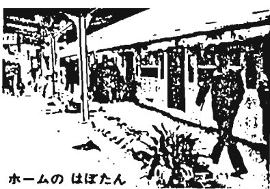
ホームのはばたん

当初の乗降客は年間4千人ぐらゐ。その後、利用者は急速に増加し、明治34年には、年間10万人を超えた。現在は千400万人。目白駅周辺は、学習院、日本女子大学、川村学園などのある文教地区。昔も今も女子学生の利用客が多い。これらから地元の入居者が、駅の美化を唱えて、昭和39年に「目白駅美化同好会」を作り、以来20年余り活発な活動を行っている。駅のホームには、色とりどりの四季の花や、超ミニ農園(1平方メートル)の作物があり、乗客の目を惹きつけてくれる。会員たちが持ち寄ったもので、地元との結びつきの強さをうかがわせる。「私どもの駅は恵まれた環境