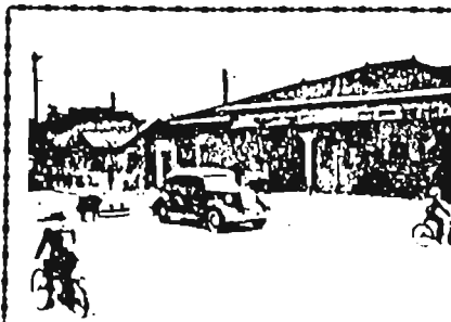
昭和10年代の目白駅前