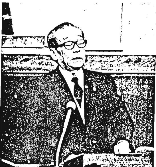
所信を表明する日比区長

財調交付金は12・3パーセントの低い伸びに 次に子算編成の前提となる昭和60年度都区財政調整は、去る2月18日正式に決定しました。その主な改正点は、従来からの懸案事項である人件費における標準員数の改定および退職手当の単位費用化、義務教育施設