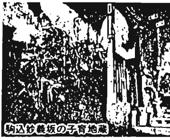
駒込妙義坂の子地蔵