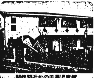
開館間近の千早児童館

ファミリースポーツ広場 4月28日(日)豊島区体育館内 内容：①午前10時～12時30分