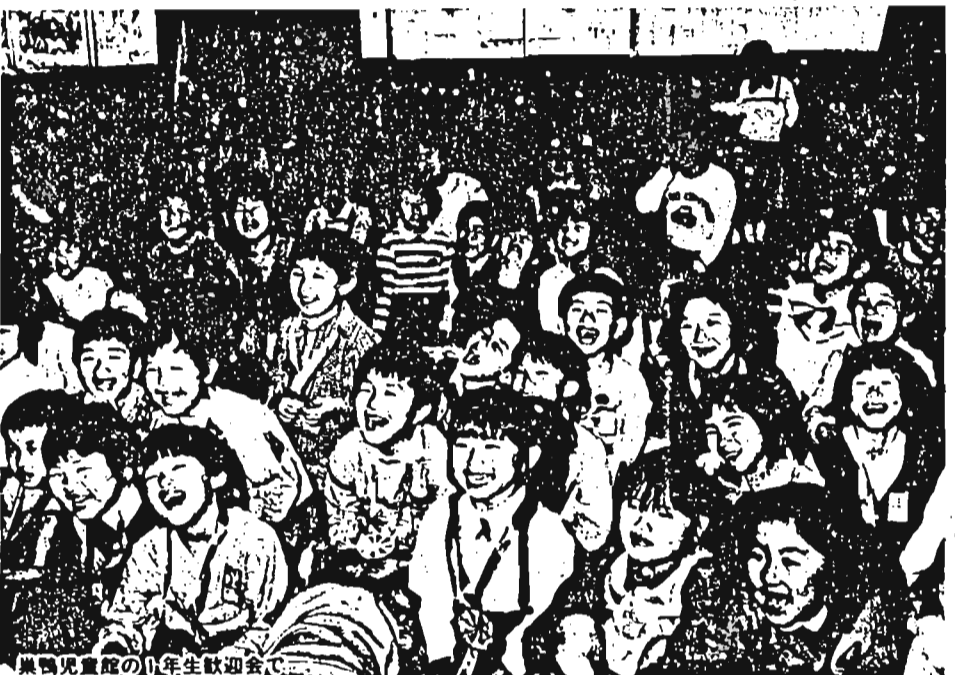
豊島児童館の1年生歓迎会

●保育サービスの充実 保育の質的充実——専従保育、障害児保育、緊急保育などの充実