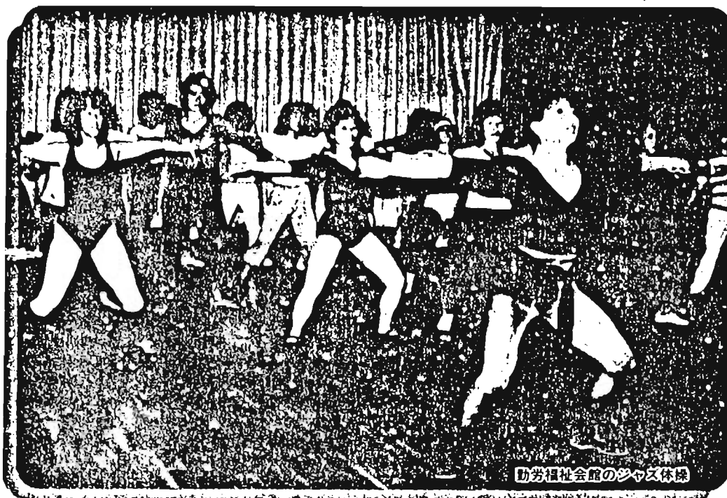
功労福祉会館のジャズ体操