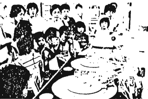
昨年の見学会・血液センターで

◇申込み：7月17日(木)午後5時までに電話で応募係☎2141へ。定員を超えた場合は抽選。結果は7月22日(月)までにお知らせします。申込みの際、第1希望日、第2希望日などをお知らせください。 ◇日時： (第1回)7月25日(木) (第2回)8月21日(木) (第3回)8月22日(木) いずれも午前8時45分から午後2時30分まで ◇集合場所：区役所正而玄関 ◇見学施設：心身障害者福祉センター、郷土資料館、造幣局、駒込血液センターなど ◇見学方法：区のマイクロバスで各施設をまわります。 ◇対象：定員：区内在住の小学3年生以上の子どもとその保護者のペアで各回10組