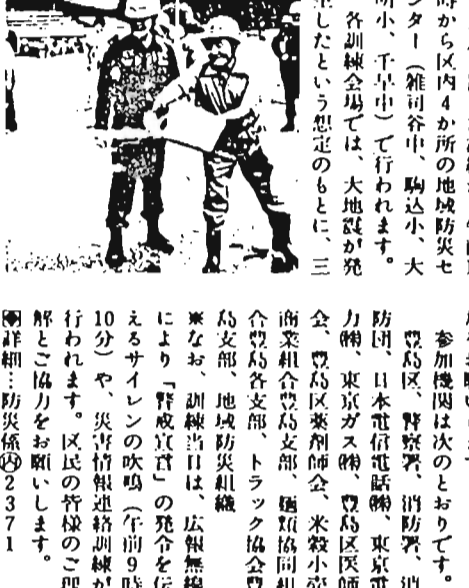
角パケツや消火器を使った消火訓練、応急救護訓練など、区民と防災関係機関が一体となった総合的な訓練が実施されます。区民の皆さまも多数のご参加をお願いします。

区では、今年も9月1日「防災の日」に総合防災訓練を実施します。災害時に被害を最小限にいとめるため、初期消火活動、広報活動、救護・救護活動に重点を置いた訓練が、午前10時から区内4か所の地域防災センター(雑司が谷中、駒込小、大明小、千早中)で行われます。各訓練会場では、大地震が発生したという想定のもとに、三