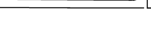
誰もが真剣なまなざし

特別区長会、国や都に来年の予算などを要望 特別区長会は、このほど国や都に對する来年度の予算・施策の要望をとりまとめた。 内容は、国に對しては、都と特別区の制度改正、保育行政の充実、在宅老人福祉施策の充実、防災対策の充実などの重点施策16項目、その他32項目の計48項目、都に對しては、老人福祉の充実、都市計画見直し一定率の充