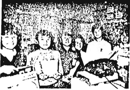
吹き込みをする放送委員のメンバー

「はい、駒込小学校です。29日は途中で雨になり、30日と2日間、運動会が行われ、とハキハキとした元気な児童の声が聞こえてくる。そして、運動会の鼓笛パレードの演奏も、昨年5月から始まった駒込小学校のテレホンサービスである。同校は区内で最初に取り組み、現在では他に数