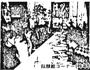
似顔絵コーナー(昨年)

◎対象：昭和40年4月2日から昭和41年4月1日までに生れた豊島区内にお住まいの方 ◎招待状の届かない方や外国人で参加ご希望の方はご連絡ください。 なお、華美な服装は避け、気軽にご参加ください。