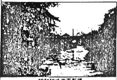
昭和初めの面影橋

そもそも高田町の高田というのは、中吉時代までは日頭(ひのと)と言われたが、後に付近一帯の台地を高田と言ったのが高田と転じたもので、昔は川原、落合、小石川の一部を含む広い地域の総称だった。鬼子母神参道目から宿坂を、もう一度下ってみよう。坂下、金楽院の斜め前に江戸時代の有力土主の墓所が知られている南蔵院がある。