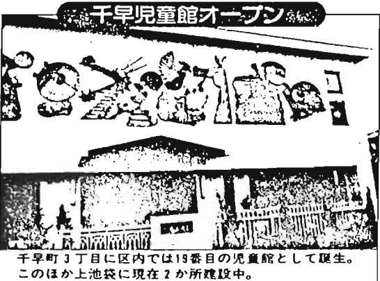
千早町3丁目に区内では19番目の児童館として誕生。このほか上池袋に現在2か所建設中。

基本計画の第3年次となつた今年昭和60年。国際青年年・国際婦人の10年最終年にちなみ様々な取組みが行われました。 また、情報公開制度も発足し、区民に開かれた区政が前進するとともに、まちづくり、行政改革の推進、福祉の向上などにも力が注がれた年でした。