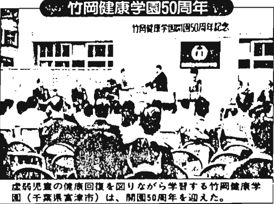
虚弱児童の健康回復を図りながら学習する竹岡健康学園(千葉県富津市)は、開園50周年を迎えた。