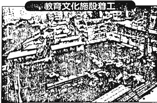
念願の教育文化施設が千登世橋で建設着工。昭和62年6月竣工の予定。