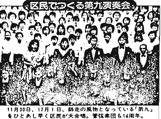
11月30日、12月1日、師走の風物となっている「第九」をひとあし早く区民が大合唱。管弦楽団も10周年。