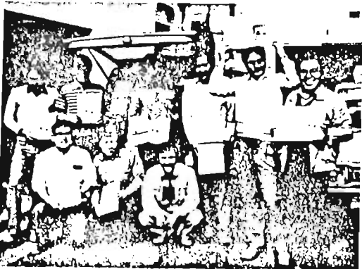
完成した絵本を手にする会員たち

「手でみる絵本」が完成した。視覚障害児のための絵本である。「ひろい、みちの、うえにバスが」とあって、うえにバスが、とあって、1台のバスがお客を乗せたり穴ぼこに落ちたりしながらも終点まで走るストーリー。絵と文字は発泡印刷という浮出印刷、点字部分は凸版浮出印刷で制作されている。障害者、健常者がいっしょ