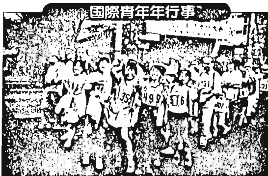
国際青年年にちなみ様々な催しが行われた。区民歩け歩け大会(10月10日)では青年年記念コースも登場。