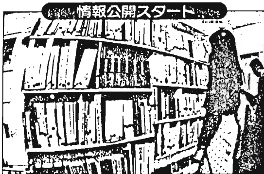
区内では目黒区に次いで2番目。11月までに公開請求88件、行政資料コーナー利用者は3,900人余。