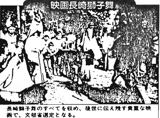
長崎獅子舞のすべてを収め、後世に伝え残す貴重な映画で、文部省選定となる。