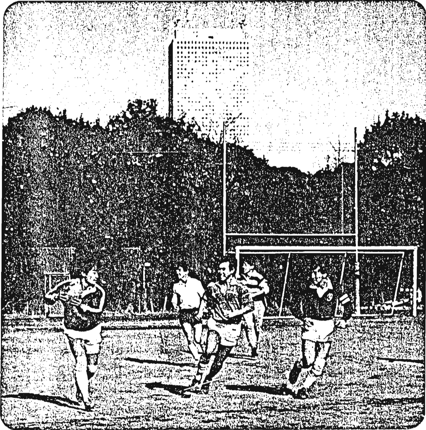
学習院大学ラグビー部