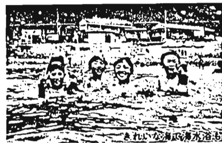
きれいな海水浴場