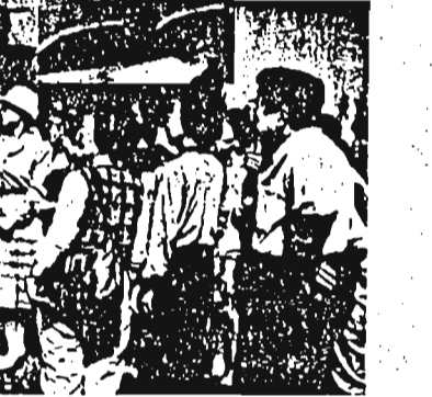
池袋駅前での初めてのキャンペーン

皆さんが体験された消費生活上の諸問題や、消費者行政に対してのご意見、ご要望を、区の施策に反映させるため、消費生活モニターを募集します。 関心のある方、勉強してみたい方、積極的に応募ください。