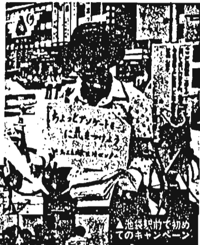
池袋駅前での初めてのキャンペーン

「あなただけの」おしやれを手作りで ◇日程・内容：「やさしい創作リフォームについて」 ②2月6日(木)「つくってましよう」ワイシャツからブラウスを