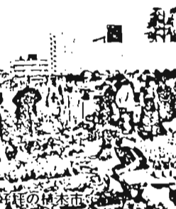
誕生記念樹の苗木市

●誕生記念樹配布 区内に誕生を祝います。ご希望の方は同封のハガキをお申し込みください。なお、出生届を区外で出された方、区内の届かない方は、公園緑地課へお申し込みください。