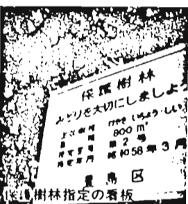
保護樹林指定の看板

若葉が一段とあざやかな輝きをみせ、私達の心とからだを洗い清めてくれます。 区民1人当たりの公園面積が0.45平方メートルと23区の中で最も少ない。 ●生垣造成の費用を助成 生垣の美しい街なみは地域にも安全です。また、少ないスペースの緑化にも適しています。新たに生垣をつくる場合などは、費用の一部を助成します。