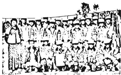
東鴨学園高校：所在地は上池袋1-21-1。生徒数1,105名 男子高 軟式庭球部員数34名。

3月30日、全国からの代表24校が参加して愛知県体育館で行われた「第11回全日本高等学校軟式庭球大会」で、東鴨学園高校軟式庭球部が9年ぶり2度目の優勝を飾った。