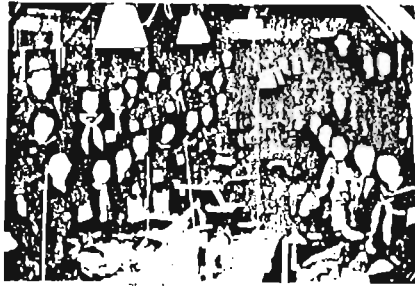
千早町のミシン村にあった工場に、労働員で来た学生たち

昨年11月12月に開催した企画展「戦中・戦後の区民生活」は大変好評で、毎年開催してほしいという要望も多く、今年も国際平和年を記念する意味から、第2回企画展を開催することになりました。 今年も前回の展示会以降、資料館に提供された資料を加えて、次の5つのテーマで行います。 ● 軍隊にとらわれて ● 軍事訓練、出征関係資料 ● 軍隊での生活用品など ● 戦時下の民衆生活 ● 集団疎開の子供たち ● 区内小学校提供の学童疎開写真、千早4丁目ミシン村への学徒労働員など ● 空襲の炎のなかで ● 平和を求めて ● 戦争直後の生活難 このほか、区議会での原水爆禁止の取り組みなども紹介。