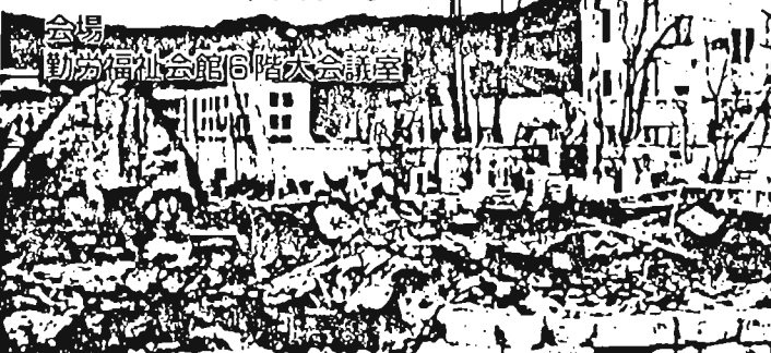
会場 勤労福祉会館6階大会議室