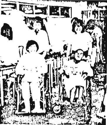
都立清瀬療養園で

「会社を定年退職したんですが、せっかくなので何か社会のお役に立てようなことをしたい」と初老の男性。主人も理解してくれるので、今後は自分の身の丈に合った活動を続けたいという主婦。それにたくさんの若者。6月6日の「はへと塾」の開塾式には、様々な顔が集った。 豊島区社会福祉協議会などが昭和59年に開いたボランティア・アスクールの受講者が中心となり、今年度から「はへと塾」がスタートした。 「はへと塾」は、高齢者、若者、主婦、学生など、様々な世代のメンバーが参加し、互いに学び合い、自立したボランティア活動を目指している。 今年度は、7月10日(日)に都立清瀬療養園で、第1回研修会を開催する。この研修会では、ボランティア活動の意義や、活動の仕方について学び、実際に活動体験を行う。また、先輩ボランティアとの交流も行う。 「はへと塾」の活動は、地域社会の活性化に貢献し、高齢者の生活の質を向上させること、若者の社会参加を促進すること、主婦の社会参加を支援することなどが目的である。