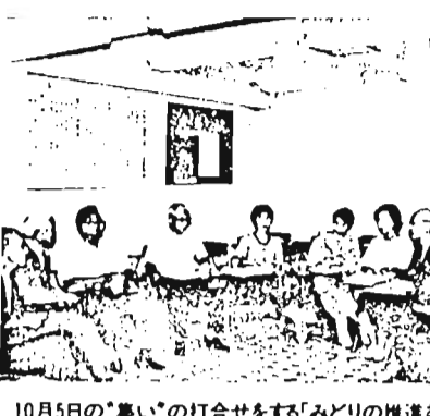
10月5日の「集い」の打合せをする「みどりの推進委員」

東京の自然を保護し、回復しようとする「みどりの監視員」制度が誕生したのは13年前の昭和48年。昭和59年には、東京都緑の増進計画も発表され、今後20年間に、都内の樹木を1億本から2億本に、1人あたりの公園面積を3.1㎡から6.0㎡に倍増する予定である。今年6月、「みどりの監視員」から改称された「みどりの推進委員」は都内